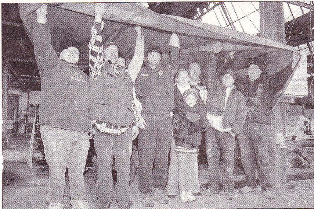
Wagenbouwers proberen zich droog te houden.